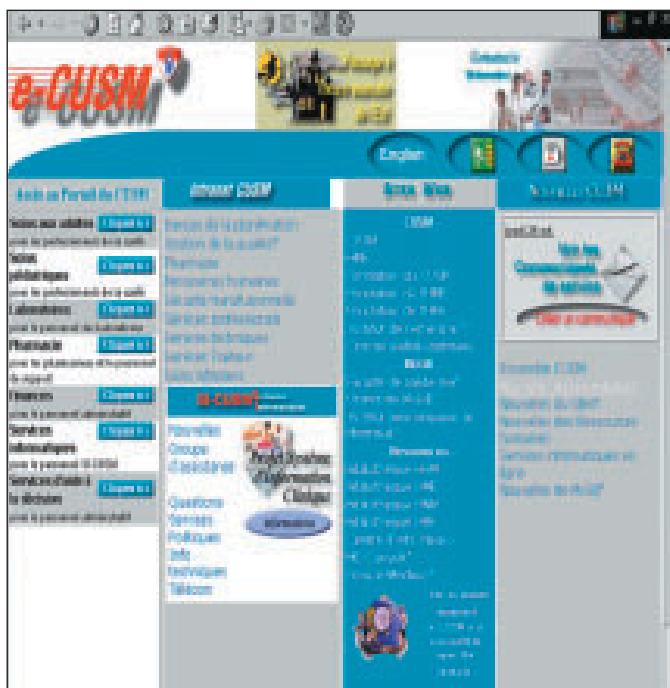
Figure 1 : Portrait intranet CUSM (version française)