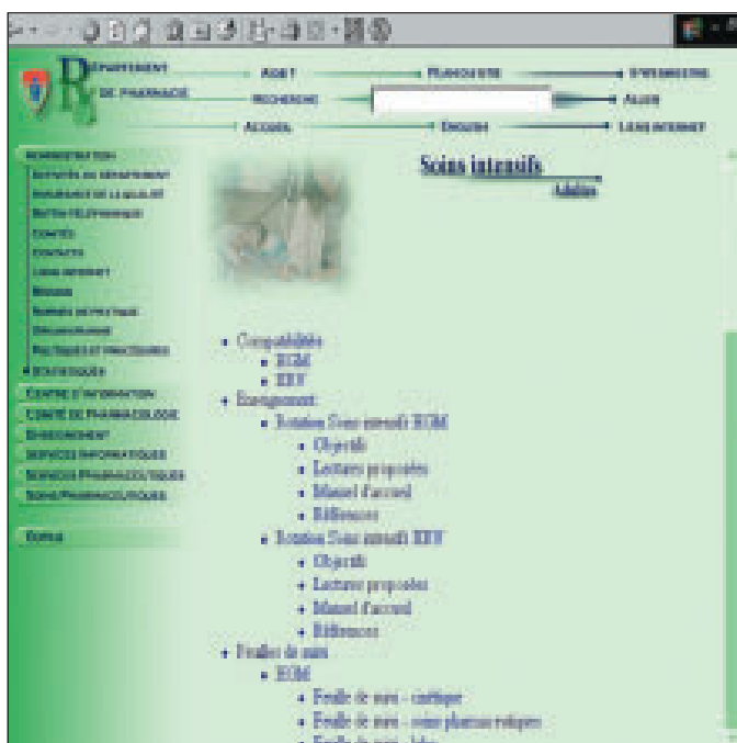
Figure 4 : Page spécialité soins intensifs avec sous-menu administration

Ce menu est dynamique (Flash) et en cliquant sur chaque bouton, on accède à un sous-menu qui permet d'atteindre rapidement l'information désirée (Figure 4). Par exemple, en cliquant sur le bouton Administration , nous pouvons consulter le bottin du département pour obtenir un numéro de téléphone, de téléavertisseur ou une adresse électronique d'un collègue. De plus, en cliquant sur l'adresse de courriel, cela appelle le programme Lotus Notes et une nouvelle fenêtre s'ouvre pour vous permettre d'envoyer un message à la personne choisie.